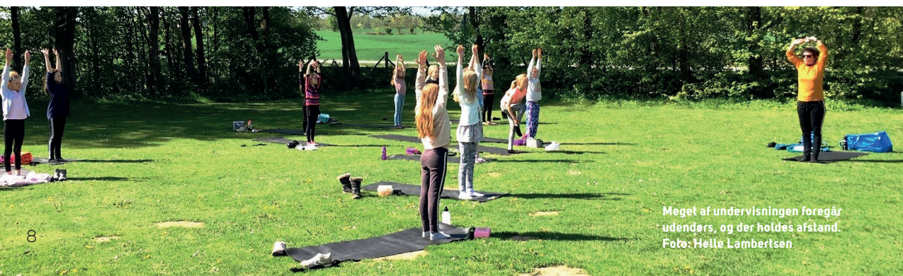
Meget af undervisningen foregår udendørs, og der holdes afstand.

For de ansatte i den pædagogiske kultur er det også vant praksis at være nysgerrig på læring og udvikling,